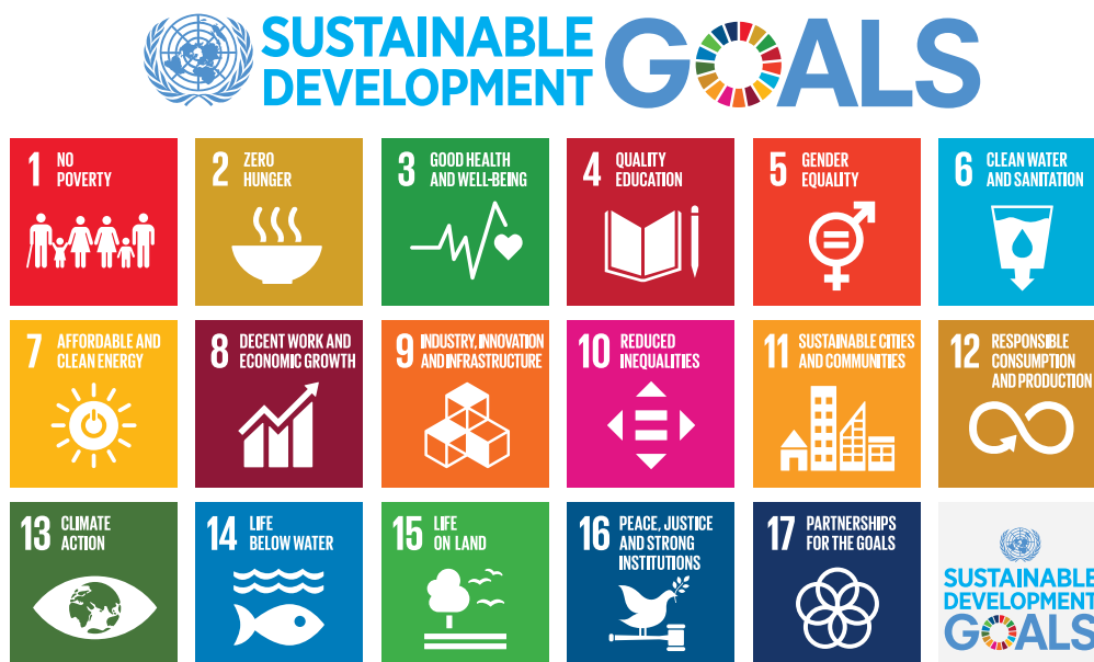
Rajah 2: Matlamat Pelaksanaan Sustainable Development Goals (SDGs) (UNDP, 2015)

Bagi melestarikan peranan zakat yang merupakan salah satu penyumbang ekonomi negara, semua pihak perlu berganding bahu dalam membangunkan dan merangka strategi yang lebih berkesan ke arah pemeraksanaan asnaf melalui pelaksanaan aktiviti berasaskan sustainable initiatives samada bagi pihak syarikat korporat yang menggunakan medium wakalah dalam pengagihan zakat serta pusat-pusat zakat yang terlibat dalam pengurusan zakat. Berikut merupakan Rajah maklumat bagi 17 matlamat yang diperkenalkan dalam Sustainable Development Goals (SDGs).